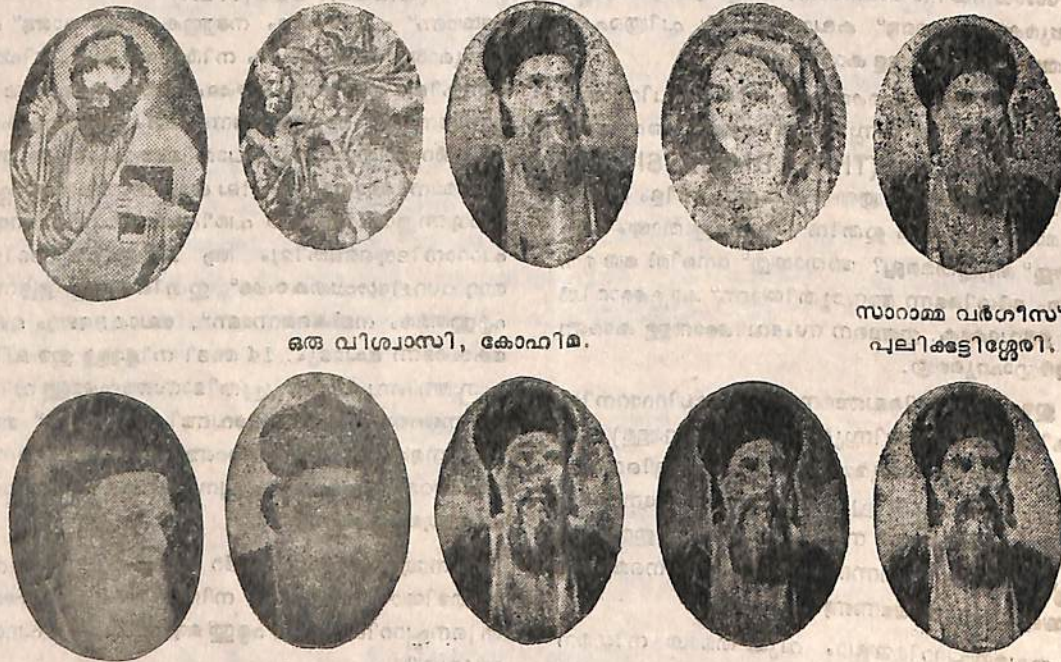
ഒരു വിശ്വാസി, കോഫിമ.